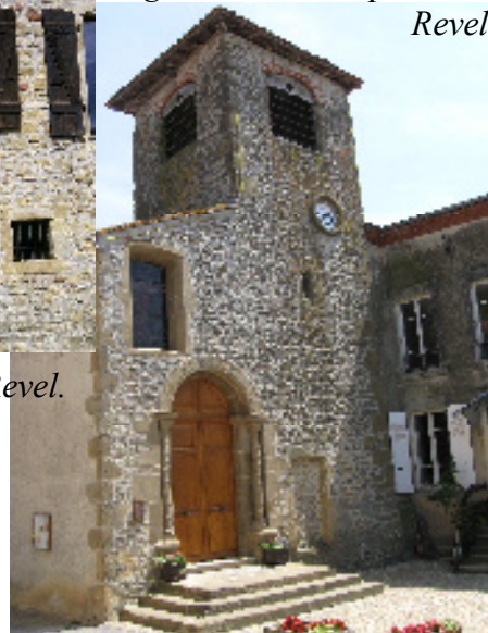
Église St Jean-Baptiste de Revel