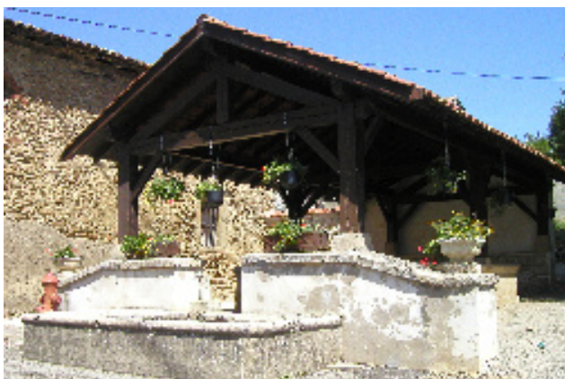
Lavoir rue du Bourg Vieux