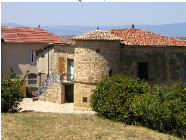
Maison Forte de Buffevent, site du Croton

La création de l'association « Renaissance de Revel et Tourdan » dans les années 70 a contribué au fil du temps à une prise de conscience municipale de la richesse du patrimoine communal.