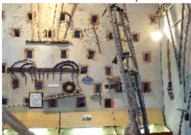
Le Pigeonnier : musée des traditions rurales

Ces actions sont aujourd'hui prolongées par la restauration de l'église de Tourdan et un projet de Site d'Interprétation Patrimonial. Le dossier du lavoir des Terreaux s'inscrit donc tout naturellement dans cette politique de sauvegarde et mise en valeur.