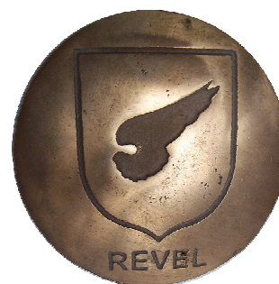
Blason de la Famille De Revel balisant le circuit patrimonial.

Ces actions sont aujourd'hui prolongées par la restauration de l'église de Tourdan et un projet de Site d'Interprétation Patrimonial. Le dossier du lavoir des Terreaux s'inscrit donc tout naturellement dans cette politique de sauvegarde et mise en valeur.