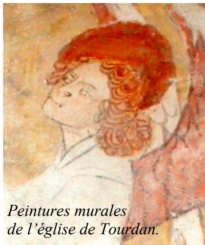
Peintures murales de l'église de Tourdan.

Ces actions ont été confortées par la naissance de l'Association « Agir pour nos églises » qui s'investit dans la restauration des deux édifices religieux du village.