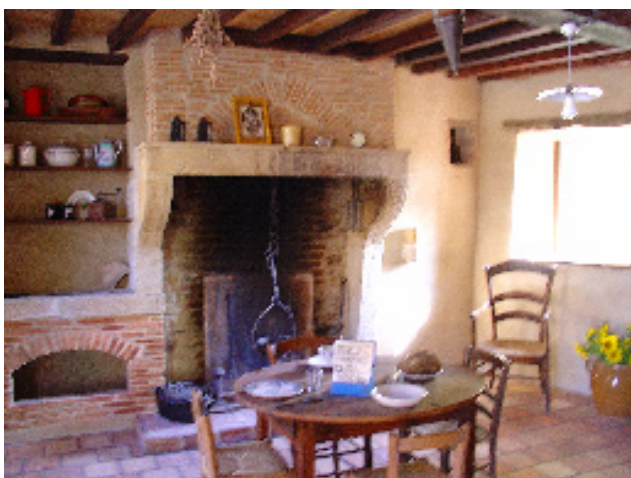
Maison du patrimoine.

la maison forte de Buffevent, aujourd'hui foyer rural, du lavoir de Tourdan ou encore de la maison du patrimoine, ancienne maison caractéristique du bourg faisant office de ferme.