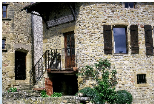
Habitations du Bourg vieux de Revel.