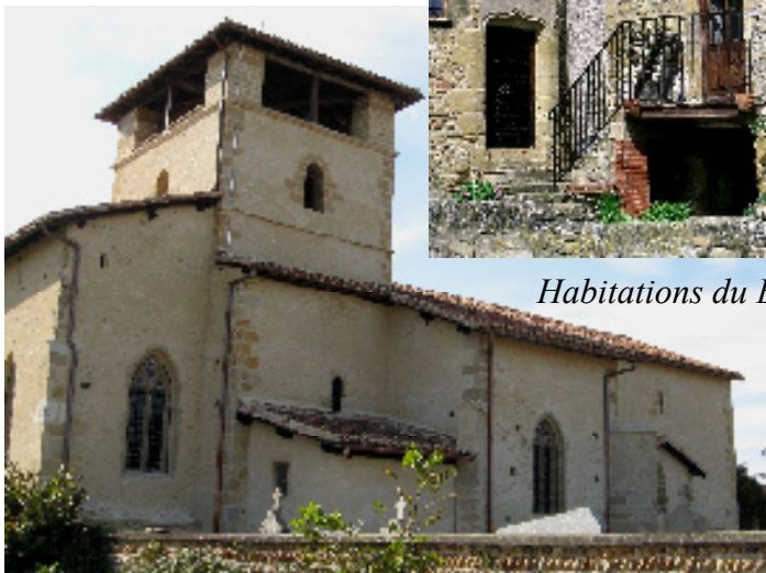
Église Notre Dame de Tourdan

Aujourd'hui, au milieu des cultures, l'église et le prieuré veillent sur les fermes en pisé des alentours. Sur le coteau, Revel et son château apparaissent aux alentours de l'an 1000. Au cours du Moyen-âge, le village et son église sont clos de remparts avec 3 portes d'entrée au pied desquelles se trouvent divers points d'eau, ancêtres de nos lavoirs.