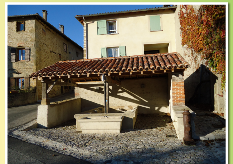
Bour de Revel Le lavoir des Terreaux