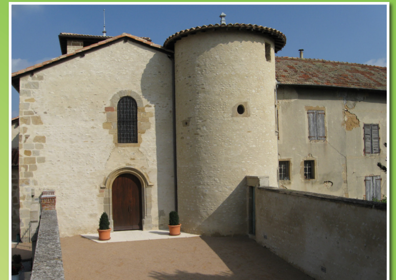
Bour de Tourdan Église Notre-Dame de Tourdan