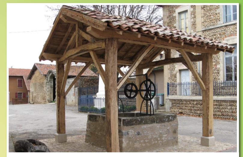
Puits de la place de Tourdan