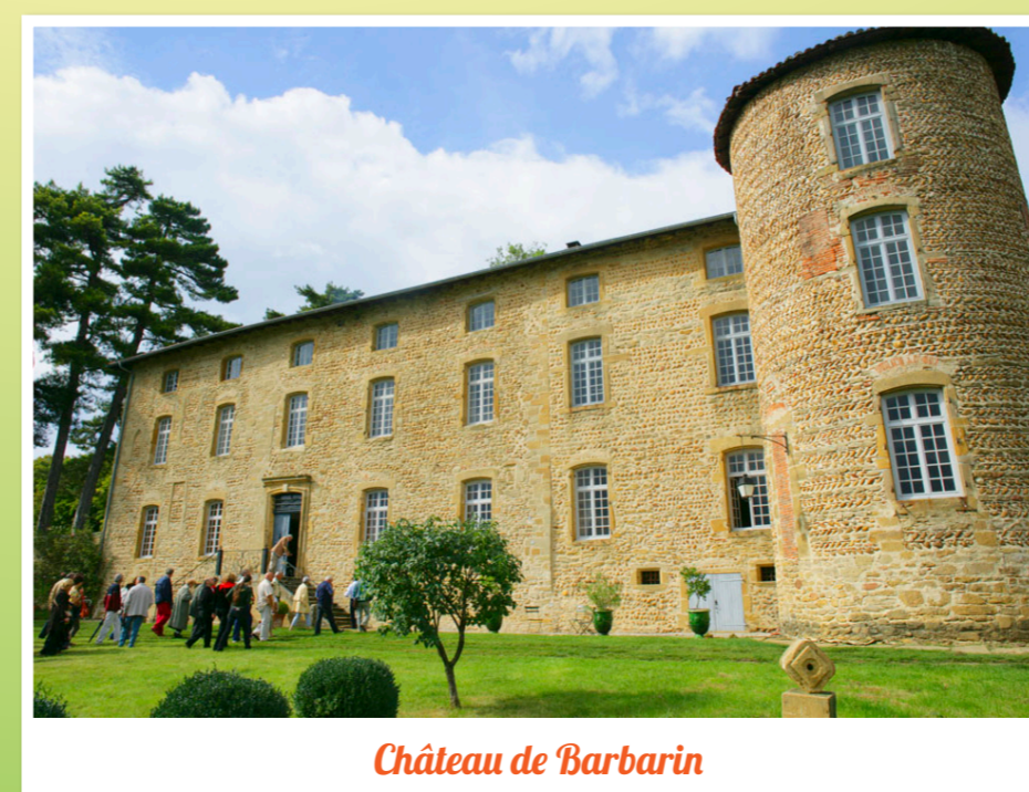
Château de Barbarin