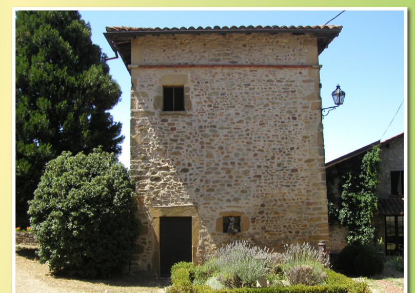
Bour de Revel Musée des traditions rurales - Le Pigeonnier