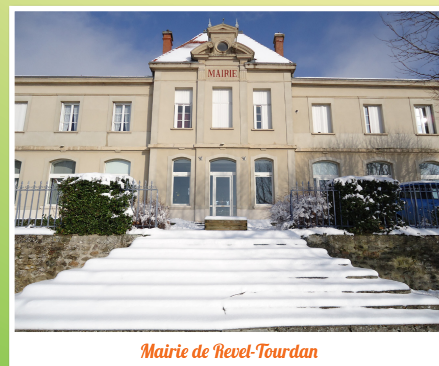
Mairie de Revel-Tourdan