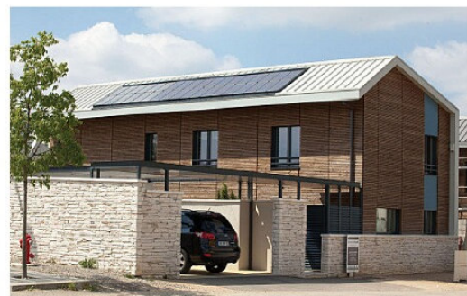
Exemple de projet d'habitat intermédiaire incorporant dans son architecture les espaces dédiés aux poubelles et autres éléments techniques. (architecte : Thierry Roche)

Pour les opérations d'ensemble, il sera prévu un emplacement aménagé pour entreposer les poubelles, commun à l'opération et adapté à la collecte sélective.